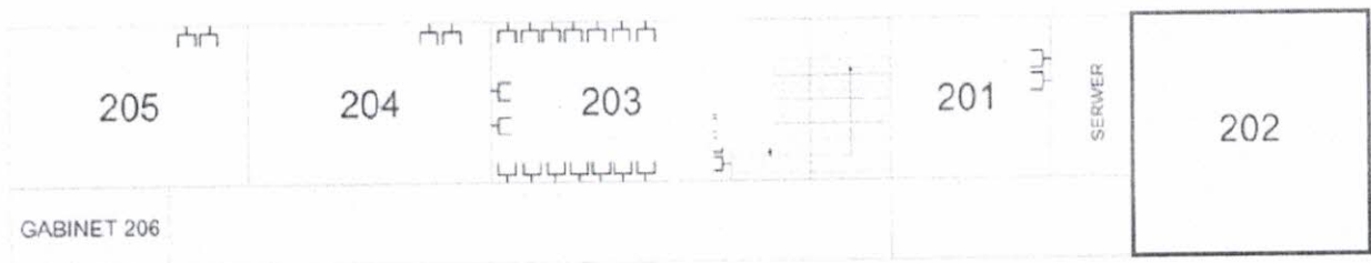
Rys. 1. II piętro budynku rzut z góry wraz z docelową ilością gniazd

Poniższe rysunki (rys. 1,2,3) są jedynie poglądowe w celu uzyskania dokładnych danych zalecana jest wizja lokalna na terenie szkoły. Kolorem niebieskim zostały oznaczone pomieszczenia posiadające infrastrukturę sieciową nie podlegającą zmianie a jedynie odpowiedniego przyłączenia do modernizowanej sieci. W każdym z pomieszczeń została rozrysowana ilość gniazd ethernetowych lecz ich ilość może się zmienić podczas wykonywania zlecenia.